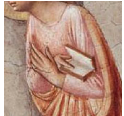
Beato Angelico, Annunciazione , Cella 3, Convento san Marco, Firenze

Che bello: Maria tiene il segno! Nell'Annunciazione di Piero della Francesca il dito di Maria fissa una pagina; nell'annunciazione del Beato Angelico sembra voler addirittura fermare il dito su una parola precisa. Gli studiosi hanno fatto e fanno mille ipotesi cercando di capire quale possa essere il brano che stava leggendo Maria. In realtà poco importa. Quello che è importante è che Maria aveva trovato un brano, una Parola della scrittura che le ha permesso di aprire il cuore all'incontro con Dio, che le ha dato la forza di dire sì al progetto di Dio, che l'ha guidata nel cammino della vita.